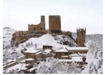
Castillo, Museo de la Torre y Palacio de Pedro IV