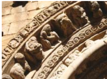
Iglesia de Santa María. Detalle de la puerta