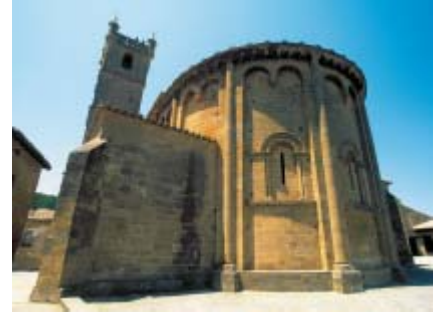
San Martín (Centro de Interpretación de Arte Religioso)