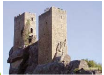
Castillo de Sibirana