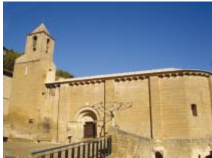
Iglesia de San Felices