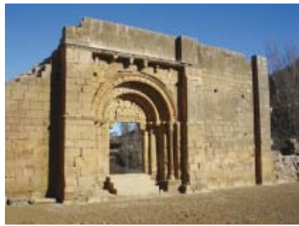
Iglesia de San Lorenzo