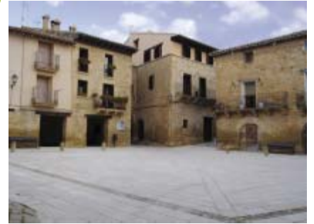
Plaza del Mercado