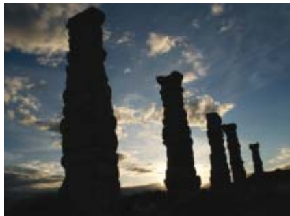
Los Bañales (Acueducto)